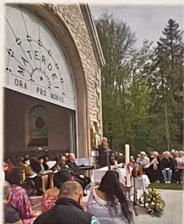
Reliques de St-B-J Labre et statue de Notre-Dame du Chêne