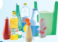
Bouteilles, flacons, sacs et films en plastique