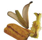
Restes de repas (sauf viande et poisson)