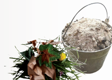
Déchets verts feuilles mortes, fleurs fanées, taille de haies, tonte, cendres, sciure et copeaux de bois