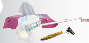
Déchets d'hygiène, couches, lingettes