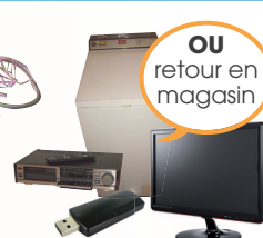
Déchets d'équipement électriques et électroniques