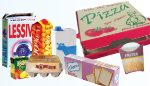
Cartons, cartonnettes, briques alimentaires