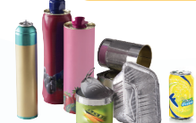
Aérosols, cannettes, boîtes de conserve en aluminium et en acier