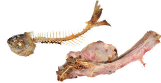
Restes de repas viande et poisson