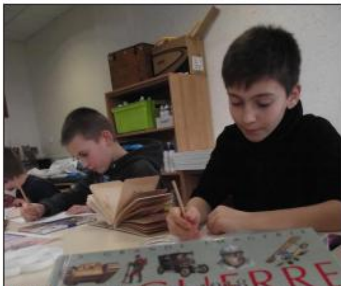
■ Peintures, poèmes, textes, les carnets de guerre regrouperont différents travaux autour de la vie de Louis Lautrey.